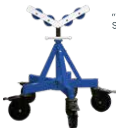
„Maxi Flex“ Servante de tube

Useful tools from DWT: Pipe jack stands for handling pipes