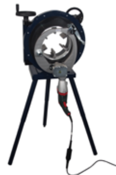
Scie orbitale pour tubes 230