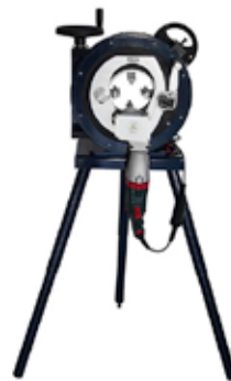
Scie orbitale pour tubes 130