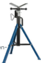
„Servante de tube pliable“ Aussi disponible avec différentes têtes de rouleaux